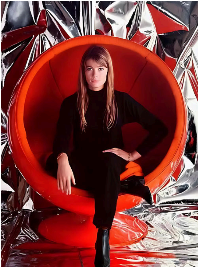
Françoise Hardy la « Ball Chair » d'Eero Aarnio, photographiée par Jean-Marie Périer en novembre 1966.

La composition musicale de Frank & Louise se notera alors d'une autre tonalité au profit de ce que Jean Louis Curtis nomme d'anatolisme "un tissu complexe de moments cinématographiques dépourvu de contenu dramatique, anecdotique, mais non point de charge affective". Le temps se veut latent, à l'état pur. De ce dialogue corporel entre danse, musique et arts visuels va naître au plateau l'image d'un son d'une pellicule qui tourne, se brouille puis qui se rembobine et nous embobine. La musique rendra visible des expériences silencieuses, elle s'ajoutera et se cumulera aux répliques tout en prenant au fur et à mesure possession du plateau. Elle fera écho à toute cette puissance créatrice des années 60_70, ouverte aussi sur le futur avec ses formes psychédéliques, ses sonorités électroniques ouvertes sur l'espace temporel.