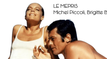
LA PISCINE, Romy Schneider, Alain Delon

Michel Piccoli, Brigitte Bardot avec livre sur Fritz Lang.