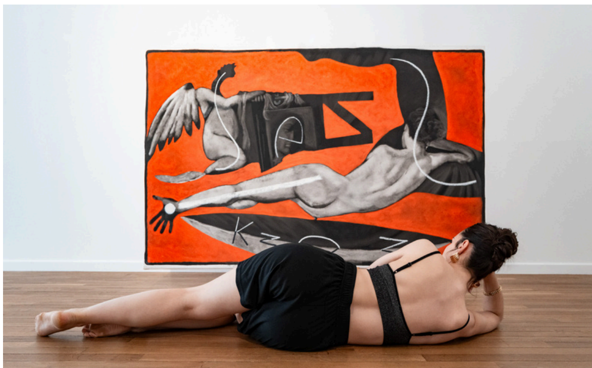
Série des Fuck-Maitres, 2020 Vincent Corpet